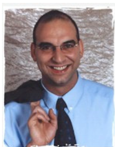
Bürgermeister Klaus Schejna

erzielt. Im letzten Vertragsjahr betrug die Einsparung mit 42.665 EUR rund 12,5 % der Jahresenergie- und Wasserkosten. Auch zukünftig wird die Fortführung des Energiemanagements durch die Verwaltung jährlich eine Entlastung des Haushalts bewirken und gleichzeitig einen Beitrag zum Klimaschutz leisten.