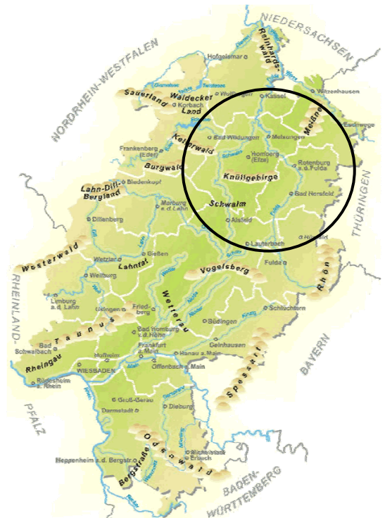
Übersichtskarte des Landes Hessen mit markiertem Projektgebiet